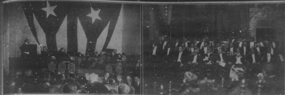
Acto inaugural de la Exposición Internacional de Higiene, que se efectúa en el ex-Convento de Santa Clara.