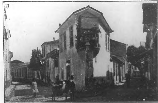
Una calle típica del barrio griego de Smyrna, uno de los más prósperos de la ciudad, antes de ser destruido totalmente por el fuego al ser incendiada la población por los turcos.

Los persas y medos de Ciro y más adelante los turcos, la avasallaron, destruyendo su prosperidad y disminuyendo su población con estupidas y estúpidas matanzas, pero Smyrna siempre renació, como el Fénix de sus cenizas, porque el espíritu de Homero había resurgido entre las calamidades de la esclavitud y el poder creador del genio helénico.