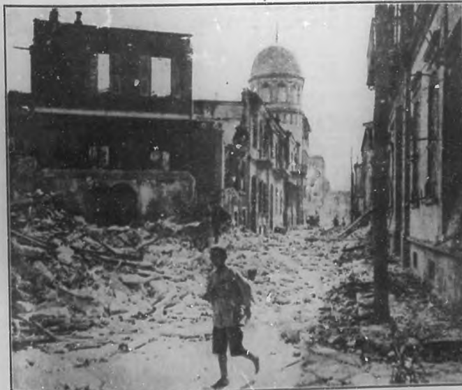
Una calle del barrio francés de Smyrna, uno de los que más sufrieron durante el incendio de la ciudad.

Al otro lado del Egeo, sobre las playas helénicas los tristes expulsados que quedaron, morcosen de frío y de hambre; pero los que sobrevivieron han heredado la esperanza de que llegará un día en que volverán a Smyrna para arrojar al invasor y reconstruir la ciudad de sus cenizas, donde a orillas del Meles, entre mirtos y romeros, cantó Homero en versos alados las proezas de su Raza.