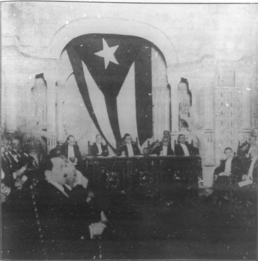
Presidencia del Sexto Congreso Médico Latino-Americano, en el acto de la inauguración en el gran teatro "Nacional".

Con motivo de la apertura del VI Congreso Médico Latino-Americano, en el Gran Teatro "Nacional", dicho acto revistió los caracteres de un gran acontecimiento científico y social, del que han de quedar muy gratos recuerdos. Estos congresos no sólo sirven para desarrollar y delucidar cuestiones de carácter científico, sino que son un motivo para estrechar aún más los lazos que deben unir fuertemente a las naciones americanas de origen latino. BOHEMIA percatándose del doble carácter de esos congresos, tan benéficos a los intereses latino-americanos, dedicará atención preferente y entusiasta al que con tanta brillantez se viene celebrando en nuestra ciudad, enviando sus felicitaciones más entusiastas al Presidente de dicho Congreso, el notable médico doctor Aristides Agramonte, una de nuestras glorias y al secretario de dicho organismo doctor Francisco M. Fernández, y a todos los miembros del Comité Organizador. Y a los señores Delegados por nuestras hermanas las repúblicas latino-americanas, nuestra cordial bienvenida.