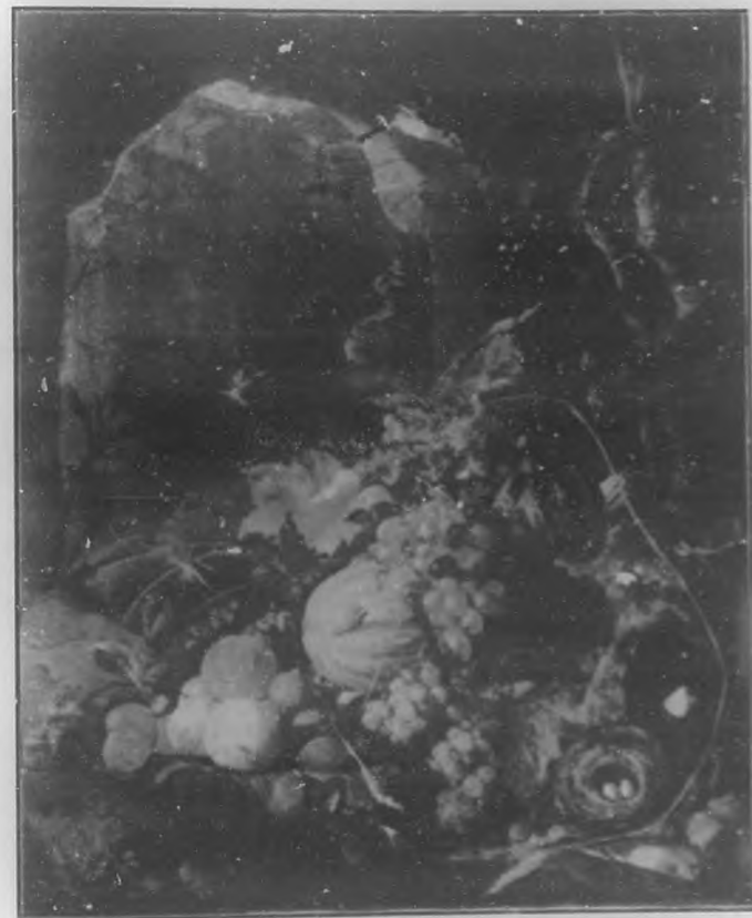
FRUTOS DE LA ESTACION Cuadro de J. D. de Heem.