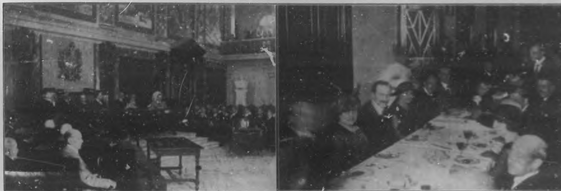
Un aspecto del solemne acto celebrado en el Aula Magna de la Universidad con motivo de la presentación de credenciales de los delegados extranjeros al VI Congreso Médico.

"Mi Campaña Hispano-americana", por Manuel Ugarte, Editorial Cervantes, Barcelona. — Bella colección de discursos del ilustre argentino, pronunciados en distintas épocas de su vida y en distintos países, y en los cuales vibra el sentimiento hispano-americano, y llega a la cumbre del entusiasmo, como un cóndor que en pleno vuelo se posase majestuosamente en el más elevado pico de la cordillera andina.