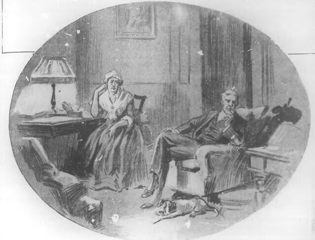
POR FERNANDA ORTIZ DE REBUSTILLOS